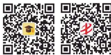
半岛教育直通车 半岛教育

您可以扫描二维码关注“半岛教育直通车”微信公众号,了解最新政策信息;扫描“半岛云课堂”二维码关注高考填报课程;扫描“半岛教育”二维码添加工作人员微信,备注学生年级、学校等信息,并留言“中考帮”或“高考帮”三个字,将由工作人员把您加入半岛微信群,畅聊中高考的大小事。