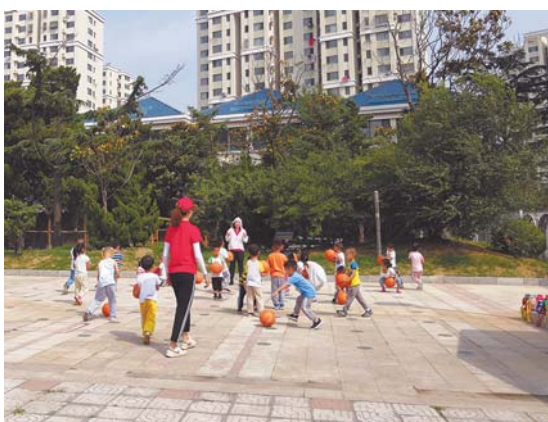
李沧区沅阳路一小区配套幼儿园(民办园)内,孩子们在户外活动,该园每月保教费为1680元。