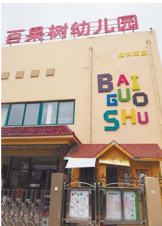
百果树幼儿园为李沧区福林苑小区配套幼儿园。

青岛市教育局2015年发布的《普惠性民办幼儿园管理办法》规定,区市财政部门应当以生均定额补助方式对普惠性民办幼儿园予以扶持,平均生均定额补助标准原则上不低于2400元/年。但尽管如此,“财政补助仍难以覆盖幼儿园高昂的办学成本”,一名从事学前教育近10年的幼儿园经营者说。以李沧区为例,转为普惠性民办幼儿园后,举办者要将保教费降至880元/月以下,虽然政府会给予一定补贴,但难以维系现有办园水平不下降。