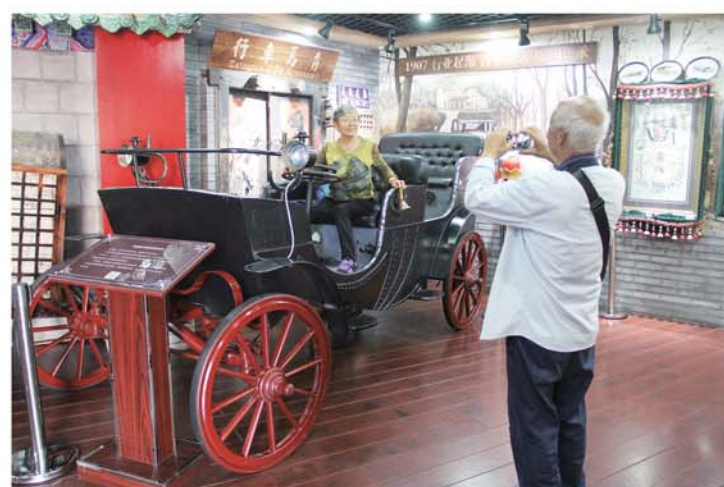
游客在博物馆内拍照留念。