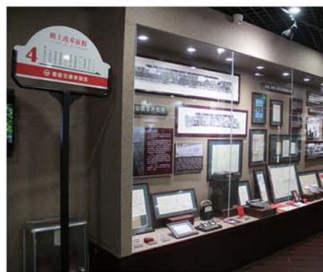
新中国成立后道路交通发展过程。