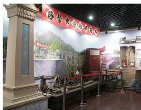
人民英雄纪念碑碑心石来自青岛崂山。