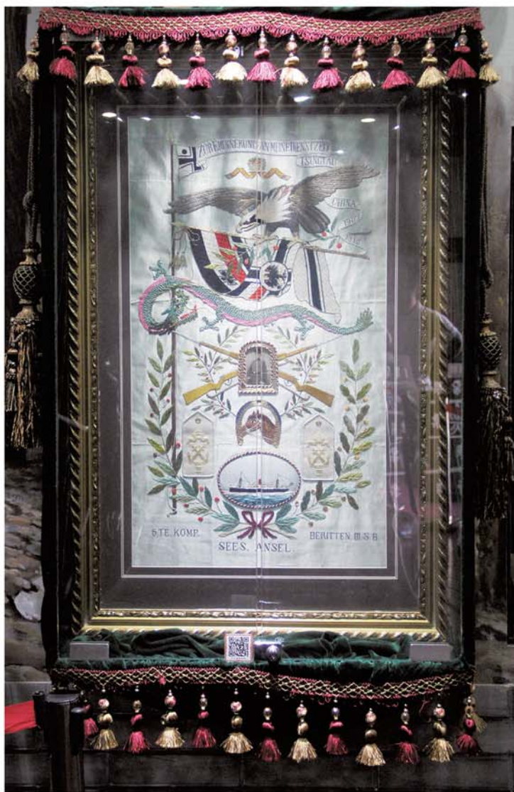
镇馆之宝——德占时期的鲁绣。