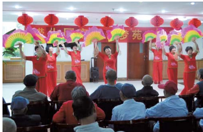
精彩的节目让老人开心过节。