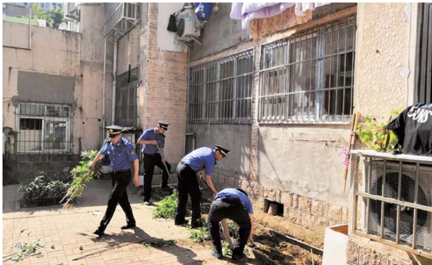
清理楼院中的毁绿种菜。

点： 为构建邻里和睦关系，促进社区和谐建设，展现社区居民风采，近日，西藏路社区在居民楼院开展“友爱邻里，齐动向前”趣味运动会。本次运动会共有5个项目：飞镖、套圈、投掷、踢毽子、捡黄豆。活动现场，老少齐上阵，相互鼓励加油。趣味运动会将娱乐与竞技相结合，增加了趣味性和健身性，充分调动了居民参与的热情，加强了邻里交流。