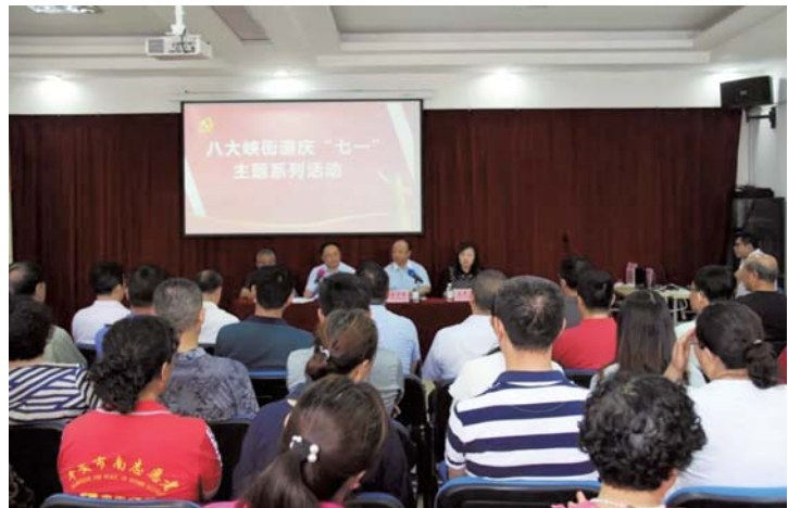
八大峡街道举办迎七一系列活动。