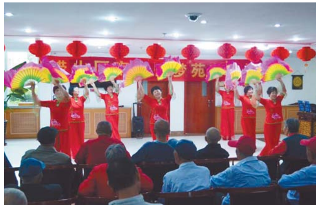
精彩的节目让老人开心过节。