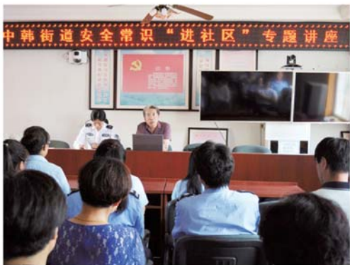
中韩街道开展安全知识讲座。