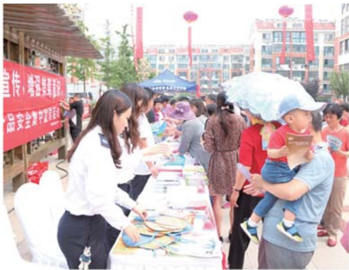
向居民普及安全知识,传授安全技能。