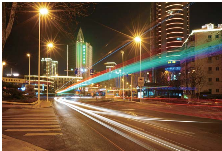
灯影流线 海大麦岛社区 刘连吉