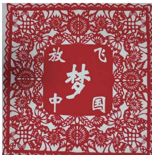
▶《七律·登庐山》 五四广场社区 王典修