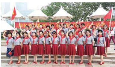
盐城路社区举办别样“儿童节”。