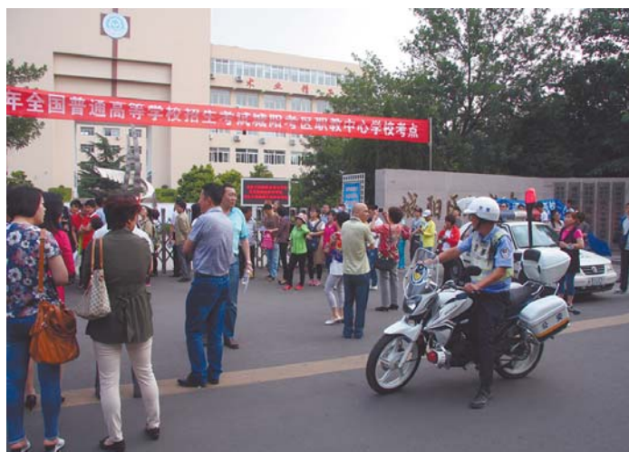
城阳交警为考生保驾护航。(资料图片)

中高考临近,当下正是考生紧张复习备考的阶段,建筑工地半夜发出的噪声却让周边居民特别是考生们心力交瘁。记者从城阳区综合行政执法局获悉,目前正在大力开展建筑工地专项整治行动,整治全区范围内的建筑工地施工噪声污染、施工扬尘污染以及渣土运输车的“飞扬撒漏”现象。