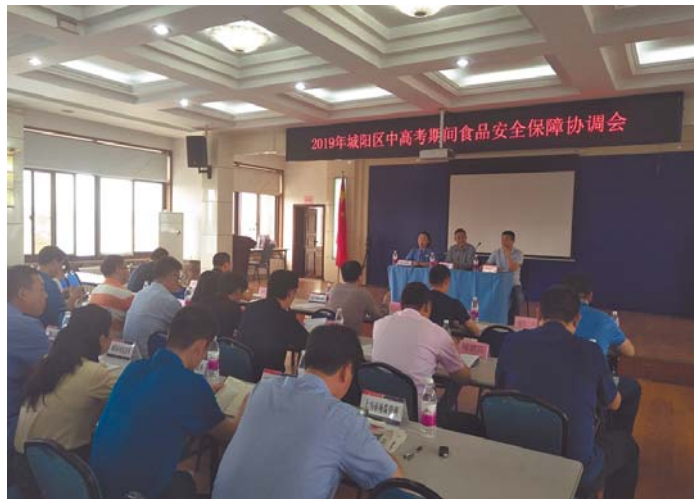
2019年城阳区中高考期间食品安全保障协调会。