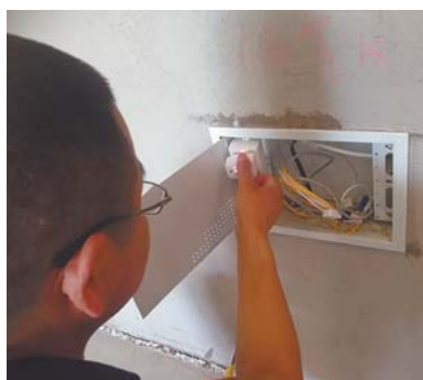
光纤入户信息箱内一插座相零错。