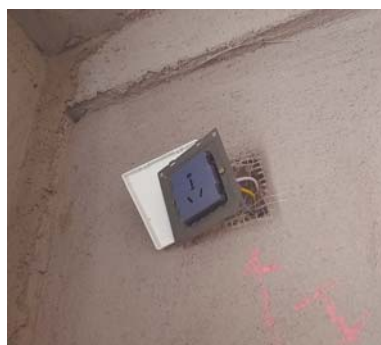
卫生间的一处插座未通电。

即墨香澜郡此前因“办理房产证”、“圈占绿地”以及“别墅漏水发霉”等问题多次被媒体报道。在结束此次验房时，记者着重观察了一下小区周边的环境。半岛公益验房团此前为30多个小区验过房，根据以往经验，但凡有别墅或洋房的居住区，多数都是人车分流，有些高层以及小高层社区，目前也能做到人车分流，其好处是可以最大程度保证园林景观绿化及行人安全。业主告诉记者，自家虽是香澜郡的洋房，但目前是地上停车位，人车不分流。