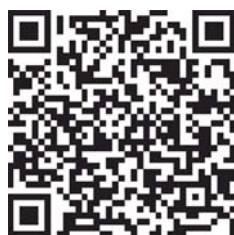
扫码观看验房现场视频。

即墨香澜郡此前因“办理房产证”、“圈占绿地”以及“别墅漏水发霉”等问题多次被媒体报道。在结束此次验房时，记者着重观察了一下小区周边的环境。半岛公益验房团此前为30多个小区验过房，根据以往经验，但凡有别墅或洋房的居住区，多数都是人车分流，有些高层以及小高层社区，目前也能做到人车分流，其好处是可以最大程度保证园林景观绿化及行人安全。业主告诉记者，自家虽是香澜郡的洋房，但目前是地上停车位，人车不分流。