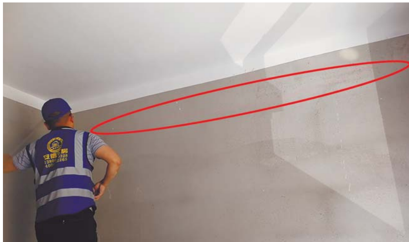
业主家有多处狭长空鼓，最长的达到4.6米。图片为其中一处。

在厨房查验墙壁的过程中，验房师用验房工具一刮，墙上抹灰层就开始纷纷往下落砂灰，记者现场拍摄了视频，可