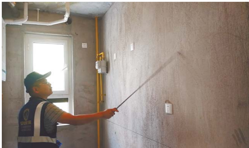
厨房墙壁有爆灰现象。