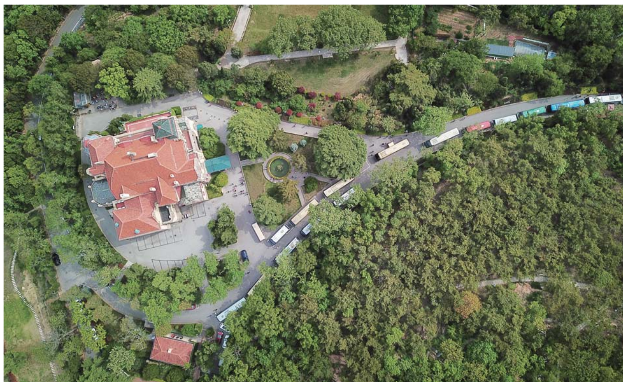
坐落于信号山麓的迎宾馆周边绿意盎然。