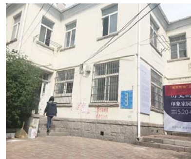
登州路17号日式别墅。