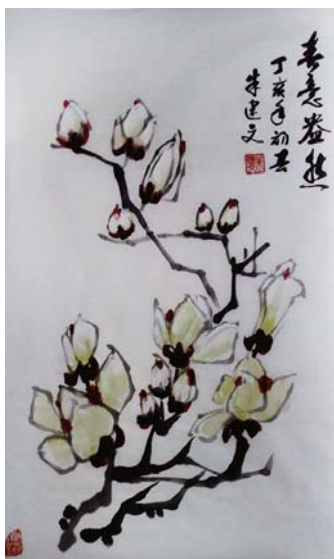
《玉兰》 高邮湖路社区 朱建文