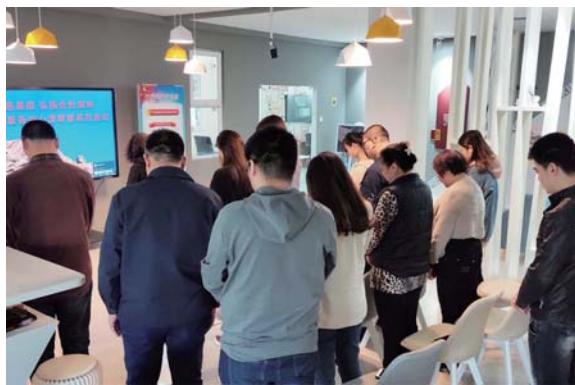
新100党群服务中心举行文明祭祀。