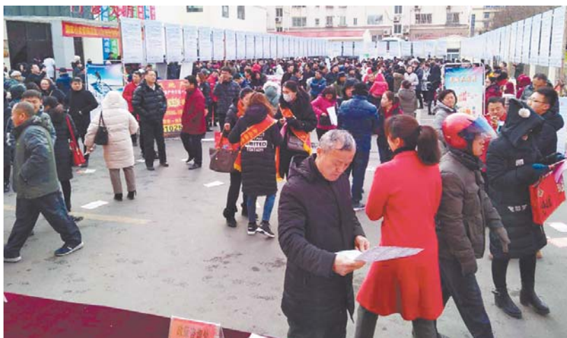
“春风送岗·和谐就业”系列招聘会现场。

据介绍,本次系列招聘民营企业占90以上,民营企业成为市场招聘的“主角”。根据胶州市机械制造产业基础雄厚,相关领域用工需求旺盛的特点,有