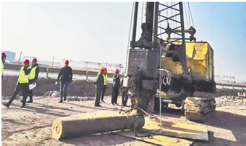
青岛胶东机场应急保障道路施工现场。