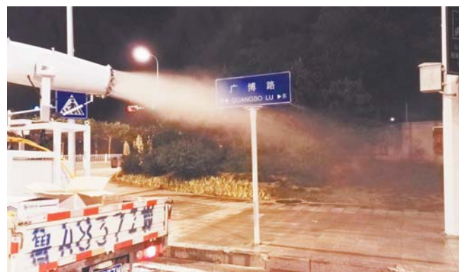
▲葫芦巷补植后效果。

深入推进违法建设治理工作,严格落实“属地管理”,明确任务,压实责任。加强日常调度,强化督导考核,发现问题、及时整改,持续巩固治理成效,提升市民居住环境。