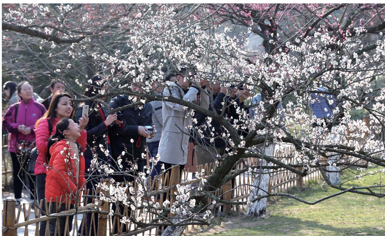
中山公园里游客争睹梅花风采。