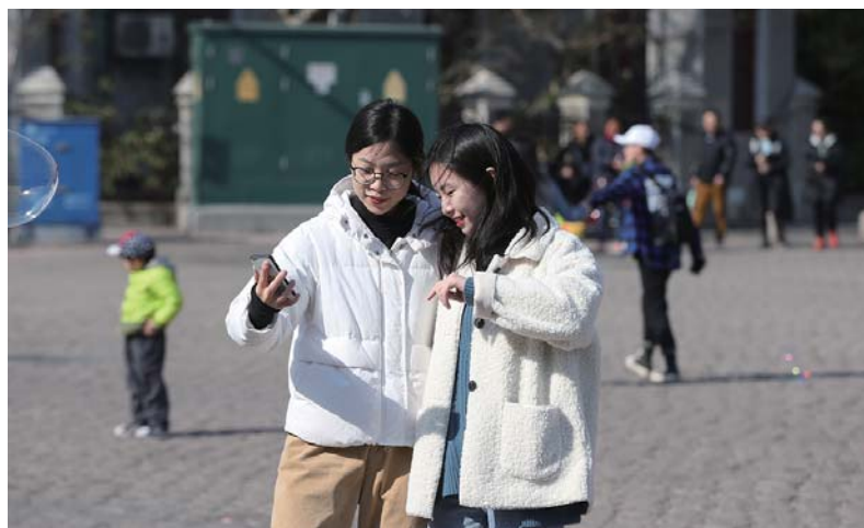
浙江路天主教堂附近，游客拍照留念。

随着天气转暖，岛城海滨景区越来越热闹，游客不断增多。3月17日，记者在一浴、二浴海边看到，不少游客趁着周末的休闲时光来到海边游玩，感受美好春光。在中山公园里，梅花争相开放，吸引了不少游人拍照留念。浙江路天主教堂附近，许多游客来这里休闲游玩，不少新人在这里拍摄婚纱照，在春日里记录下彼此的浪漫与温情。