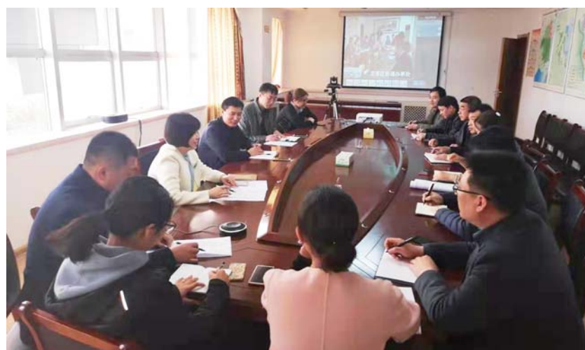
领导干部个人参加所在党支部组织生活会。