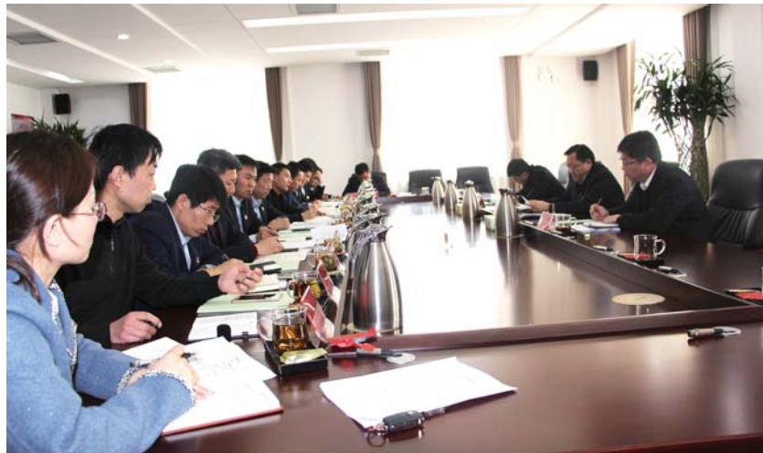
街道党工委民主生活会。

会后，大家纷纷表示，通过此次民主生活会的召开，对自身存在的问题有了更加深刻的认识，在今后的工作中，一定虚心接受批评，认真抓好整改落实，认真贯彻落实中央、省、市委要求和全区“全面抓落实、搞活一座城”“工作落实年”攻坚行动的部署，勇于担当，聚焦重点、难点、痛点、堵点，开创街道各项工作新局面。