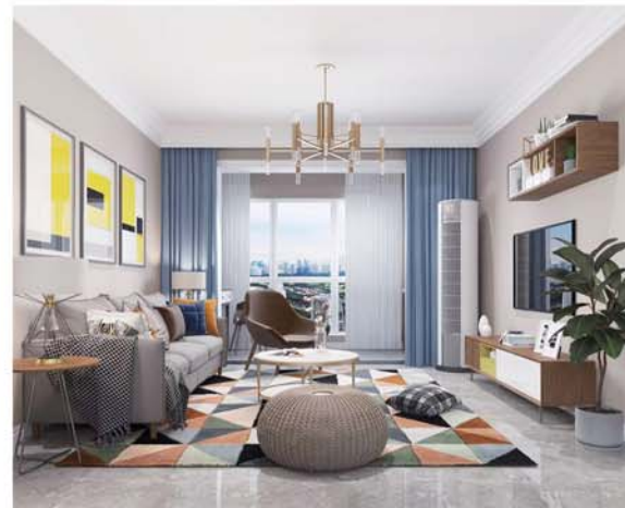
家具摆放不拘一格更凸显随意