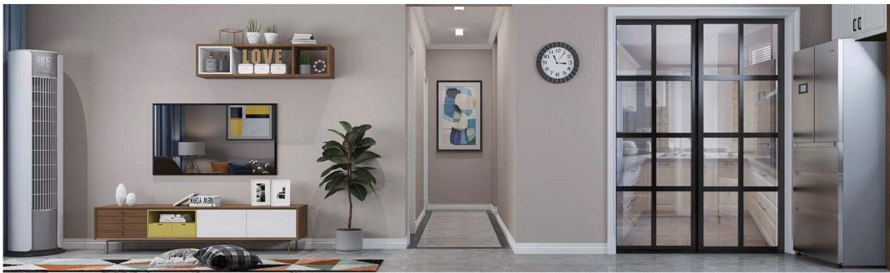
黑框玻璃推拉门让开放式客厅更干净