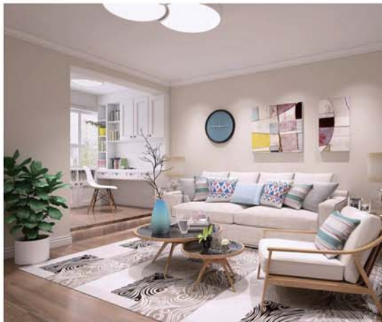
小书桌给家庭核心区带来一丝书香气