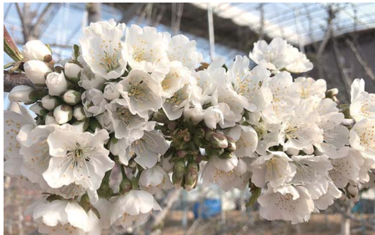
▲一簇簇的樱花渲染出浓浓春意。

无独有偶,在市南区山东路国华大厦附近,尽管岛城梅花大面积绽放还要再过些日子,但是这里背风向阳处的零星梅花已“抢跑”开放。