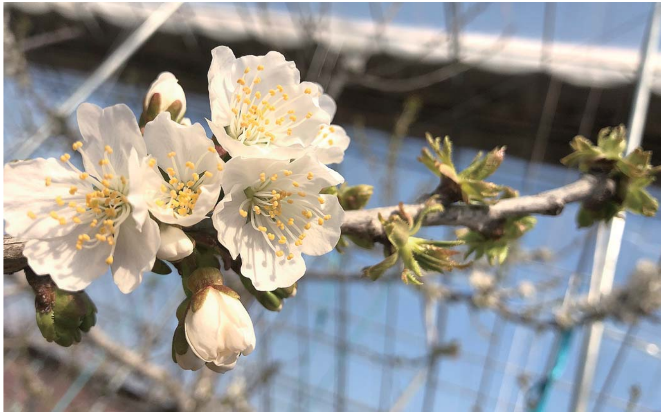
下马村樱桃大棚里的樱花俏开枝头。