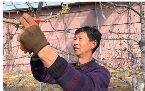
◀村民正给大棚里的樱花刻芽疏枝。