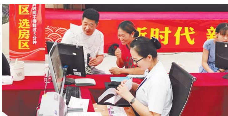
新民村村民正在高兴地选房。