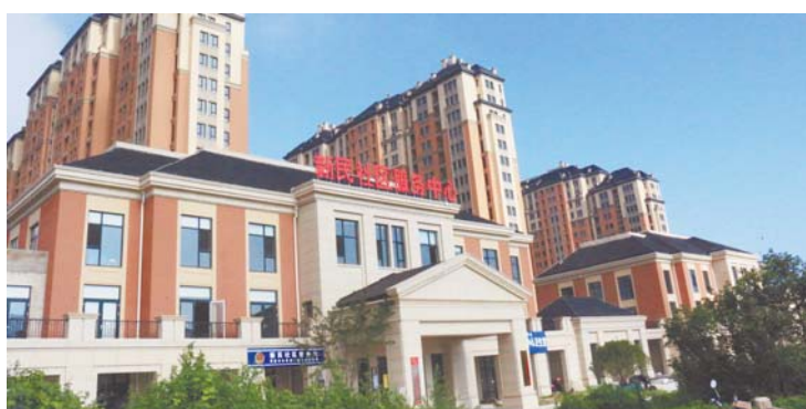
漂亮时尚的新民社区。