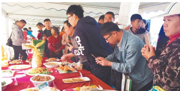
举办鳌山卫白庙芋头节,展示芋头做的美食佳肴,庆祝农民丰收。