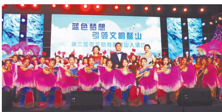
做文明有礼鳌山人活动启动仪式。