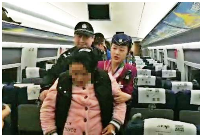
孕妇在列车上得到照顾并安全转院。(视频截图)

随后乘警和列车长又联系了青大附院的专业医生进行远程指导,乘警立即对周边旅客进行紧急疏散,给孕妇旅客提供一个良好的空气环境。