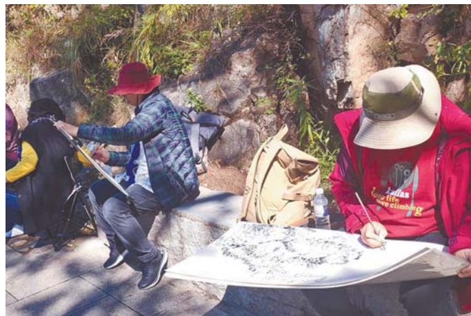
▲画家在崂山写生创作。