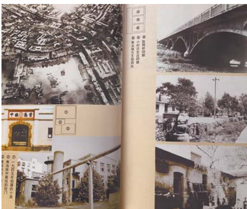
▲在《记忆中的市北》一书中，有不少关于市北的老照片