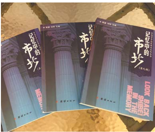
▼《记忆中的市北(第九辑)》