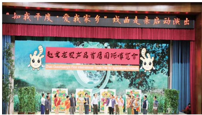
“知我平度·爱我家乡”文化系列活动

近期，平度市将组织开展“知我平度·爱我家乡”文化系列活动之“戏曲走亲”文化交流活动，届时，市级有关领导将带队分别到李沧、胶州、莱西等地开