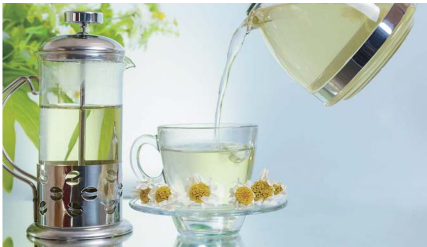
水质的好坏，也直接影响到饮水健康。

二、水越纯净越好。不少人认为水越纯越好，事实上，长期饮用纯水也会导致身体营养失调。大量饮用纯净水，会带走体内有用的微量元素，从而降低人体的免疫力，容易产生疾病。由于人体的体液是微碱性，而纯净水呈弱酸性，如果长期饮用微酸性的水，体内环境将遭到破坏。专家指出，长期饮用纯