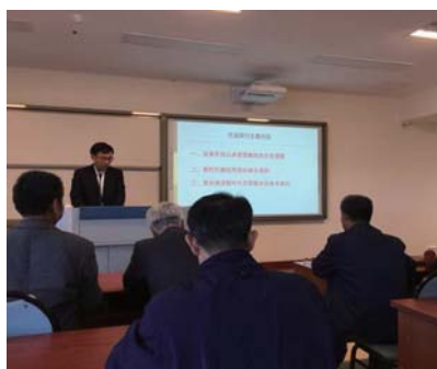
青岛市委党校与青大麦岛社区共建活动。