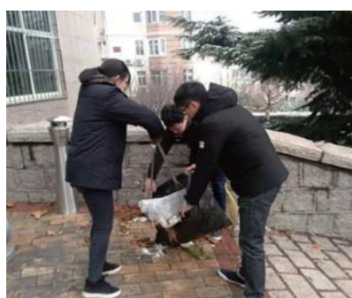
凯都社区党委与青岛市人民检察院开展清洁家园共建活动。