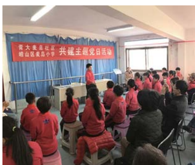
青大麦岛社区与麦岛小学主题党日主题活动。