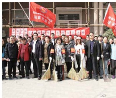
颐都社区与市中院“创建美丽崂山主题党日活动”。