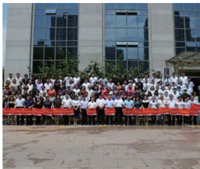
金岭管区党委举办庆祝建党97周年区域化党建联建活动。

为深入贯彻落实上级关于加强城市基层党建的相关工作要求,进一步夯实基层社会治理基础,更好地发挥基层党组织联系服务群众的战斗堡垒作用,金家岭街道党工委带领各社区党组织广泛开展了区域化党建工作。通过共驻共建共享发展资源,抓住机会平台,以党建引领促进基层治理水平的全面提升,进一步提升党员和群众的归属感和幸福感。