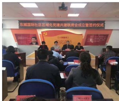
东城国际社区开展区域化党建联席会。