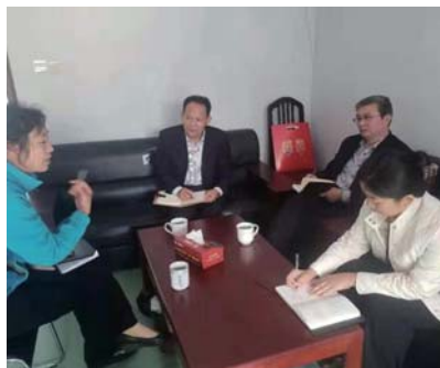
共建单位区委宣传部领导到海都社区调研。