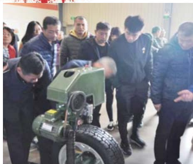
金家岭社区与双星轮胎开展党建共建活动。