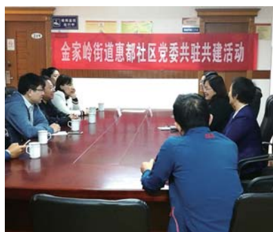
惠都社区与工程质量安全监督站座谈会。