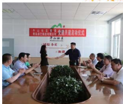
午山社区党委与青岛二中开展共建活动。