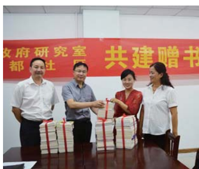
泰都社区党委与市政府研究室举行共建赠书仪式。