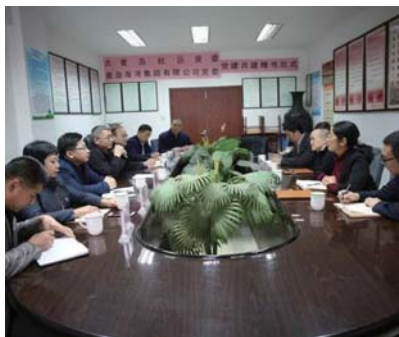
大麦岛社区党委与青岛海湾集团开展共建捐书仪式。