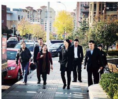
康城社区与崂山区民政局联手开展党建工作,共驻共享。