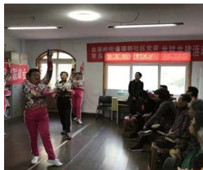
瑞都社区党委与青岛农商银行崂山支行开展共建活动。