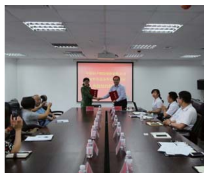
奥林社区党委与共建单位开展活动。