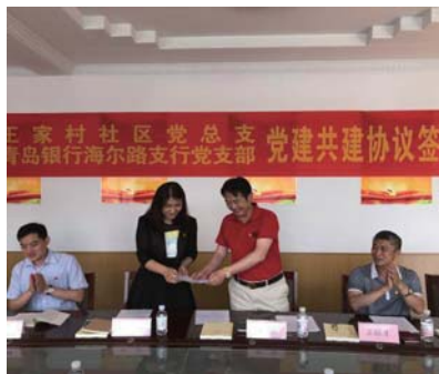
王家村社区党总支与共建单位签订党建共建协议。