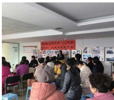
石岭路社区党委与华夏银行同安路支行开展改革开放四十周年老照片评选活动。