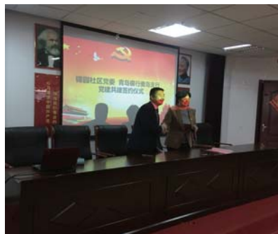
锦园社区党委与青岛银行麦岛支行开展共建活动。