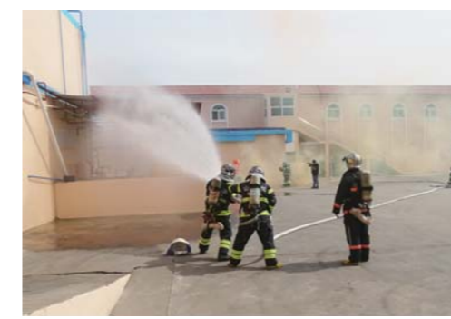
沙子口街道组织液氨泄漏应急演练。