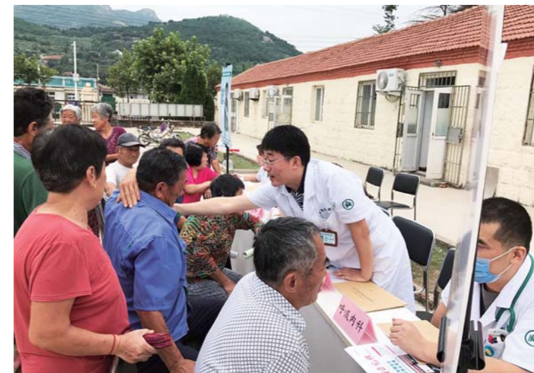
沙子口卫生院开展“服务百姓健康行动”义诊活动。