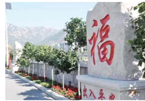
小河东社区美丽街巷“福”字一条街。