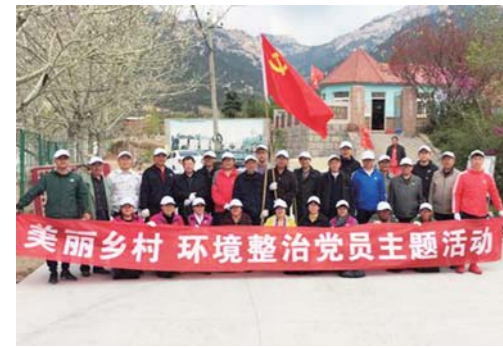
大河东主题党日活活动。