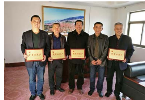
沙子口街道评选出“党员示范户”300余户,并为“党员示范户”发放牌匾。