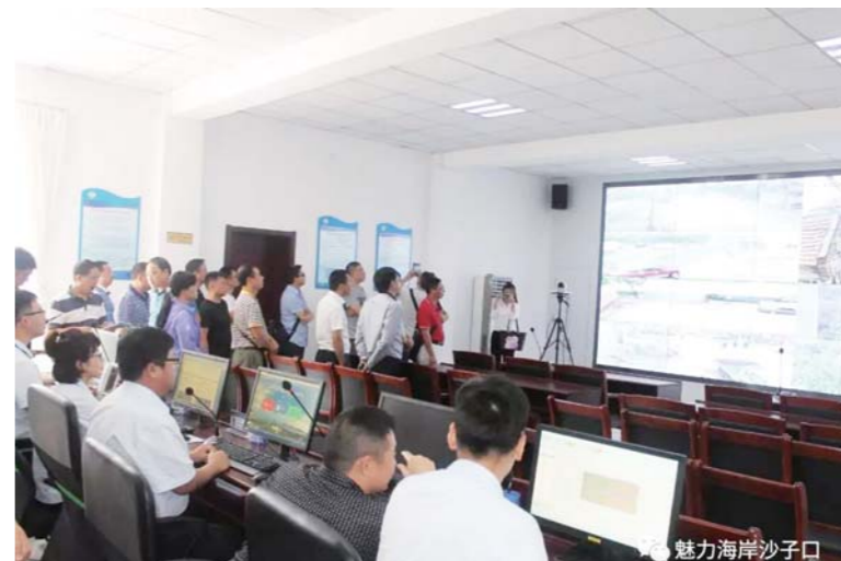
沙子口街道积极推进网格化建设工作。