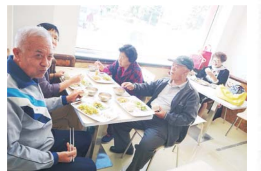
沙子口街道助老食堂开始运营。