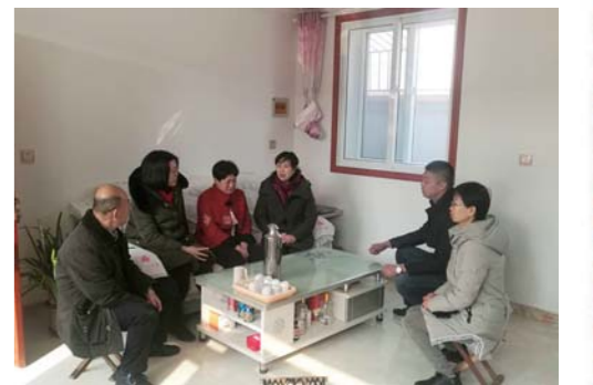
沙子口街道计生办公室走访慰问。