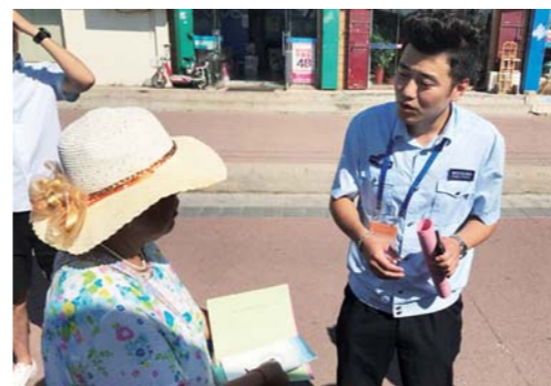
宣传扫黑除恶知识。