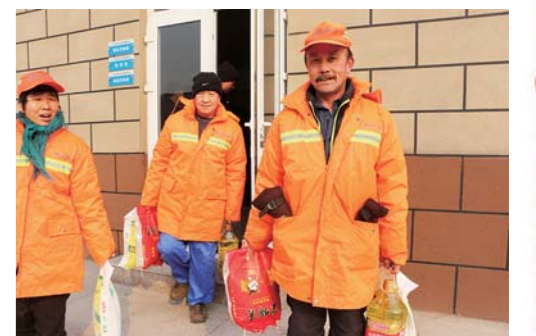
环卫工们领到慰问品很开心。