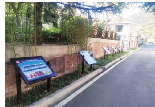
东麦窑社区法制宣传一条街。