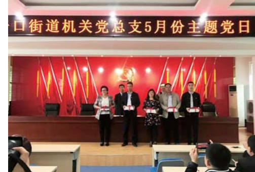
为党员过政治生日。