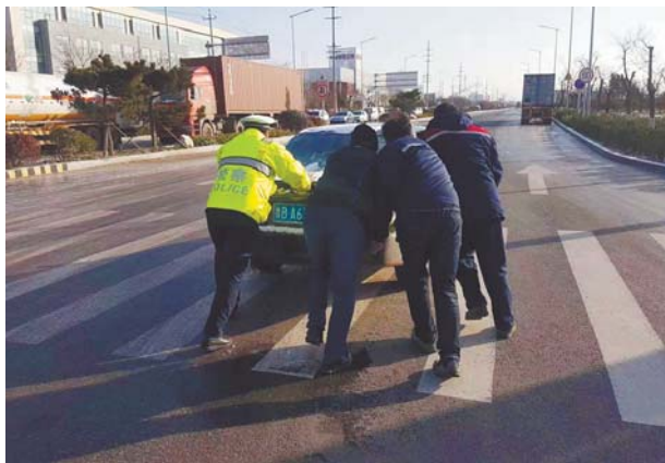
交警协助司机进行车辆转移,确保道路安全畅通。