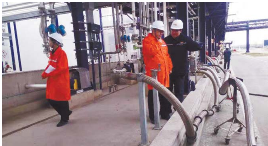
执法人员开展安全生产大检查。

按照国务院安委会部署要求,自12月初起开展为期一个月的危险化学品安全生产大检查活动。全面排查治理危险化学品事故隐患,降低安全生产风险,堵塞安全生产漏洞,强化安全生产措施。