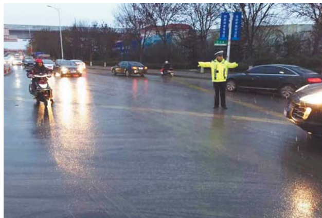
红岛街道重点路口,民警正在指挥交通。

近日,受冷空气影响,青岛迎来了今冬第一场雨夹雪。为确保辖区市民出行安全,护航道路交通安全,高新区交警大队迅速启动了应急预案,大队和三个中队全警全员上岗,在辖区红岛街道和河套街道以及园区的重点路口和路段设警力指挥疏导交通,并联系相关单位对路面积雪进行处理,确保道路交通安全有序。