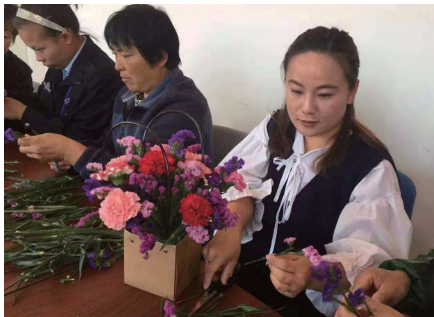
社区妇女在学习插花。

说起崂山试金石的妙处,唯独崂山出产的试金石是经亿万年海浪冲刷磨砺,石质黝黑纯正,质地细腻若肤,莹如玄玉,所以崂山试金石又有另外一个特有的称谓——玄玉。崂山试金石是中国传统的观赏石品种,独具清供、图案、奇形、象形、宝石。试金石墨石在古代被称为玄玉,本身就有着很深的文化底蕴。五行里黑色为水,水为财,有招财进宝的寓意。是其在市场上与其他玉石原材料进行差异化竞争的优势。