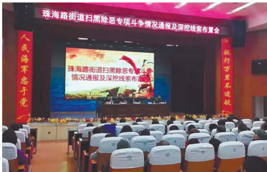
珠海路街道召开扫黑除恶专项斗争会议。

“用心做好扫黑除恶专项斗争，为居民营造一个和谐家园。”珠海路街道工作人员说，接下来珠海路街道将持续做好扫黑除恶专项斗争，以“等不起”的紧迫感、“慢不得”的危机感、“坐不住”的责任感，确保扫黑除恶专项斗争落地、措施有效、打击到位，共建“时尚珠海 幸福家园”让“时尚珠海 幸福家园”更加温馨。