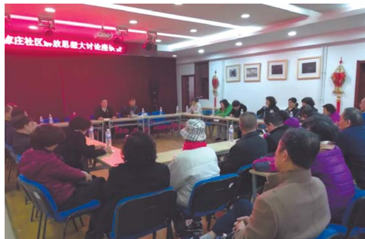
▲辛家庄社区召开解放思想大讨论会议。