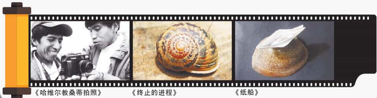
《哈维尔教桑蒂拍照》