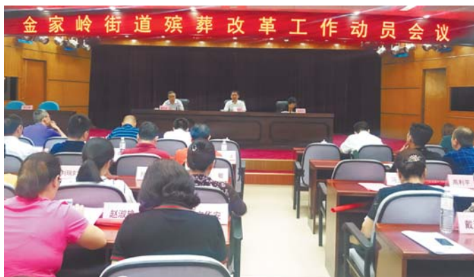
◀ 街道召开殡葬改革工作动员会。