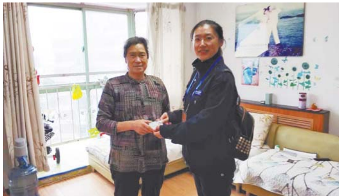
◀ 网格员将办好的证件送到老人手中。

微镜头: 为做好文明殡葬工作,金家岭各社区,尤其农村社区付出了大量心血,他们通过制定居民公约、发放明白纸及一封信等形式,广泛宣传文明祭祀的重要性,并且大部分社区都采取了将文明殡葬与社区福利紧密挂钩的措