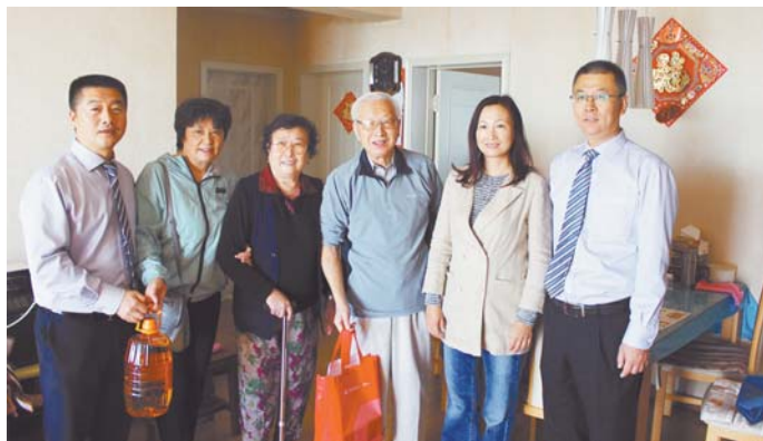
◀ 锦园社区联合爱心单位重阳节看望慰问老人。