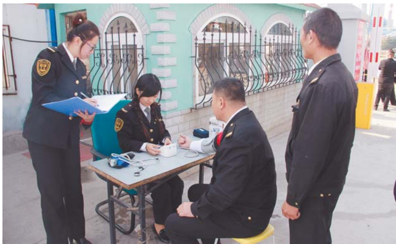
工作人员正给驾驶员进行上岗前体检。

据悉，为关爱公交车驾驶员的身体健康，防止行车途中因身体原因发生意外事故，交运温馨巴士专门建立了驾驶员健康档案，并配备了电子血压计、血