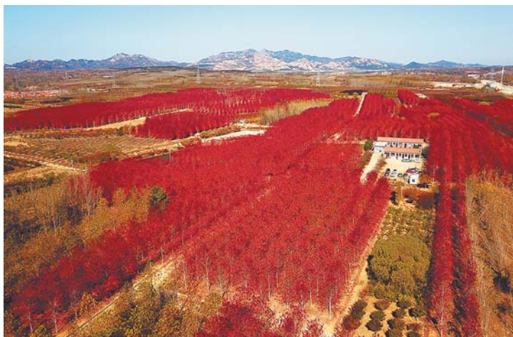
层林尽染，漫山遍野的红叶美不胜收。

从空中俯瞰，层林尽染，绚丽景色着实构成了一道难得的风景。面对着美丽的枫叶，前来观赏的人们纷纷拿出相机手机拍照留念，也有不少摄影爱好者专程前来进行拍摄创作。