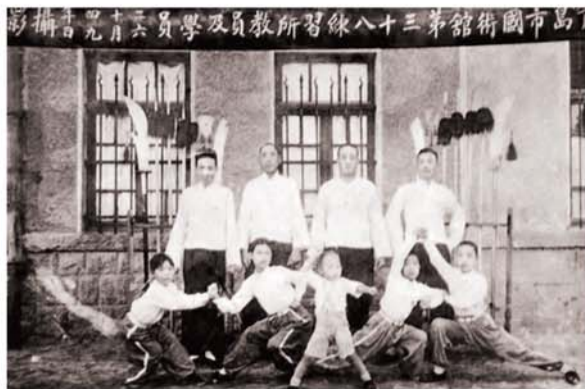
青岛市国术馆第八十三练习所合影。