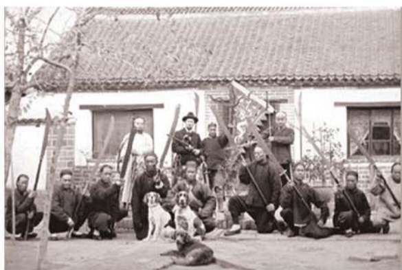
清末,外国商人与青岛民团的合影。