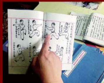
陈乐平编写的拳谱。