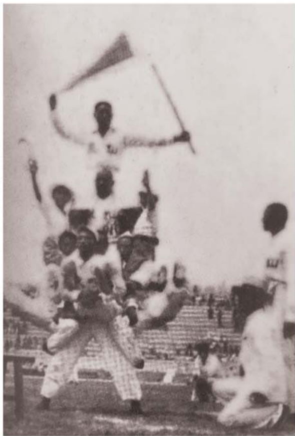
山东地区国术选手表演叠罗汉的雄姿。