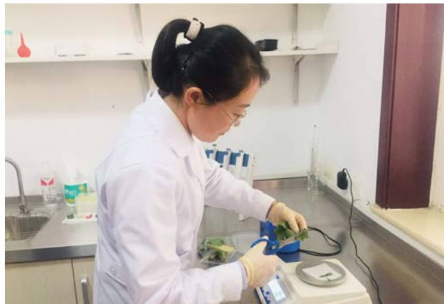
工作人员从蔬菜上取出1克作为样品。

待到五种样品全部称重放到小烧杯后,孙彦开始了下一步工作,就是向烧杯中加入500微升缓冲液,然后放到超声波振荡器中,静待一分半钟,以加速农残分离。之后取出静置5分钟,将其沉淀,