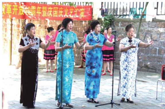
湛山街道文化活动丰富多彩。

街道文化品牌活动种类繁多、内容丰富，辖区居民参与面广、积极性高，让居民在家门口就能直观切实感受到文化惠民的获得感、满足感。