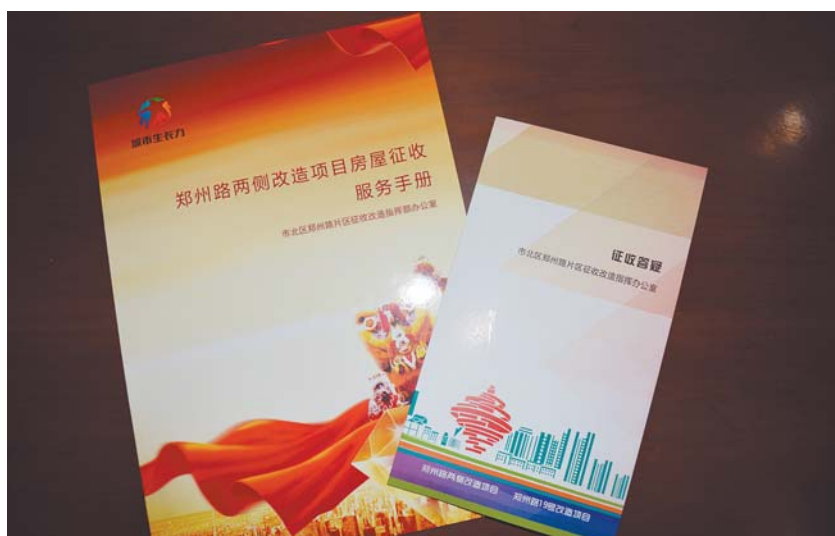
现场发放服务手册和征收答疑,解答居民疑问。