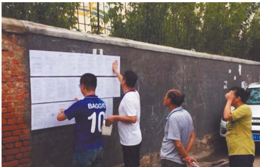
工作人员张贴征收公告。

本着“尊重历史、有利征收”的原则,区委区政府参照青岛市惯例做法,对原村民给予“进门算面积”的奖励,也就是说原村民既可以选择按照房产证载面积也可以按照土地证载面积计算补偿。按照征收程序,发布征收决定公告的同时,启动评估机构选定相关程序。为方便居民了解征收政策,相关部门还印制了征收工作服务手册、征收答疑明白纸、安置房源展板,同时设立5处集中咨询点,为广大居民提供现场咨询和政策解析。