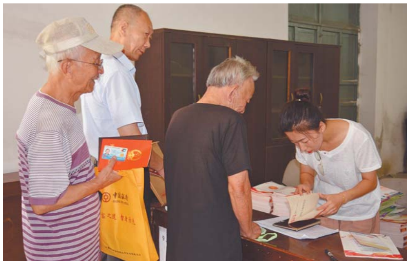
居民排队领取便民服务手册。