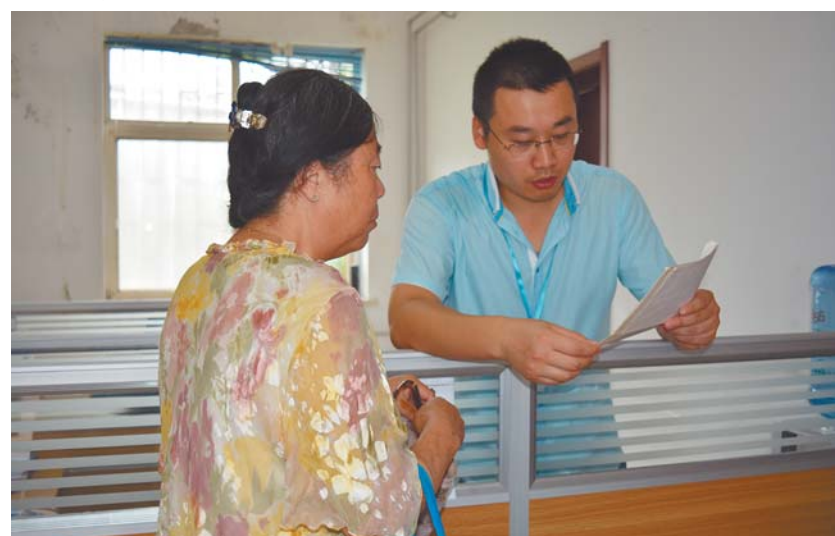
律师为居民解答疑问。