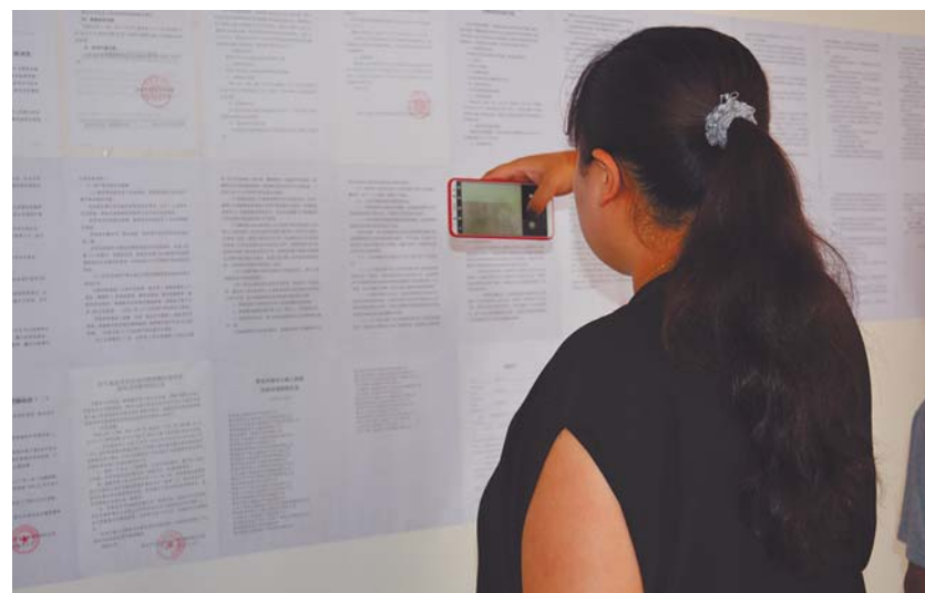
居民认真看征收公告。