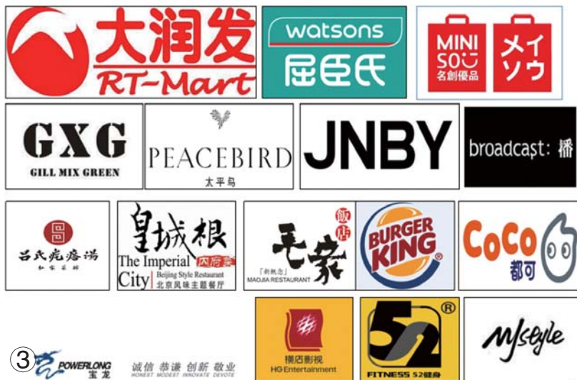
③ POWERLONG 宝龙 诚信 恭谦 创新 敬业 HONEST MODEST INNOVATE DEVOTE