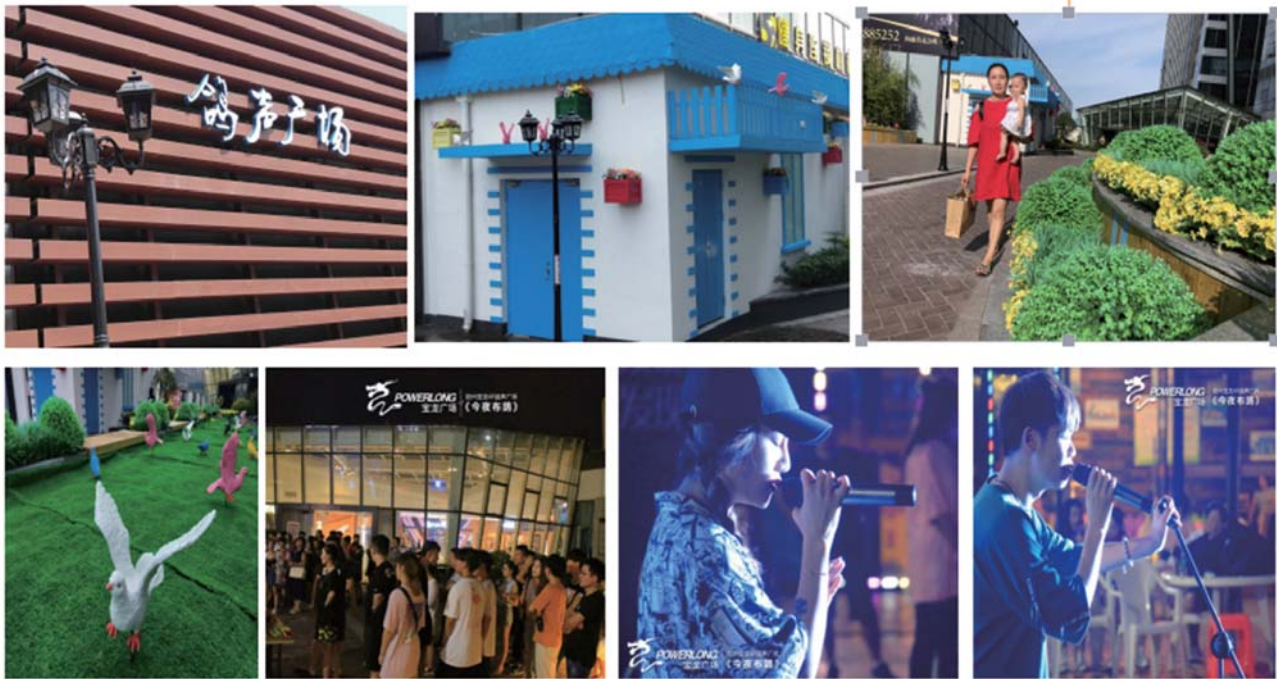
① POWERLONG 宝龙 诚信 恭谦 创新 敬业 HONEST MODEST INNOVATE DEVOTE