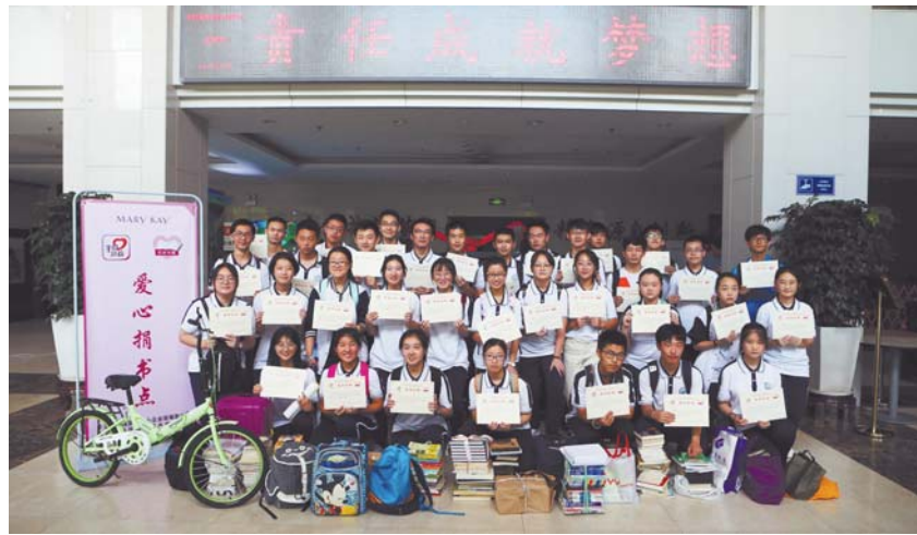
39中的同学们将捐赠的书籍送到半岛都市报后，拿着荣誉证书合影。

在捐书现场，同学们脸上洋溢着笑容，他们提着装书的大包小包陆陆续续地把书放到捐书点，每一摞书都被细心保护着，干净整洁。有的还是没有拆封的新书，被同学们包裹得整整齐齐。记者还注意到一个女同学拉着行李箱，打开后，里面的各种杂志书籍塞得满满的，还有很多自己用过的学习资料，数了数有二十多本。她说自己带来的书不