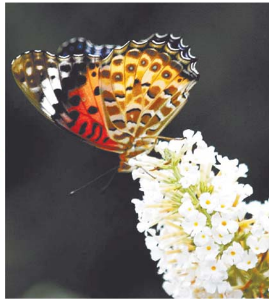
花间蝶舞 颐都社区 李爱军