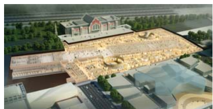
8号线地下空间效果图

(三)全国青少年篮球培训中心项目 该项目将是国内首个人工智能+体育(AI+PE)的科技体验中心,依托方圆