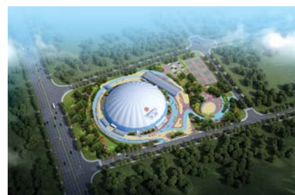
方圆体育中心效果图

项目总占地面积99.7亩,规划建筑面积163500平方米,新建楼房20座4层叠拉7栋,8层洋房5栋、13层小高层3栋、24层高层4栋,6层商务办公楼1栋。地下车库面积46021平方米,容积率2.0,绿地率不低于35%。配套幼儿园一座,总用地面积9741