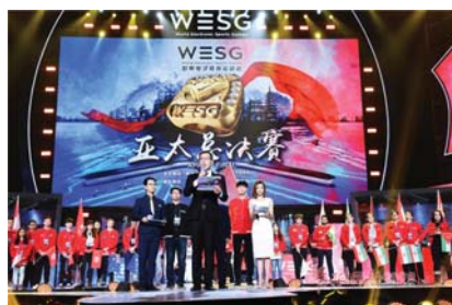
WESG亚太总决赛现场实况