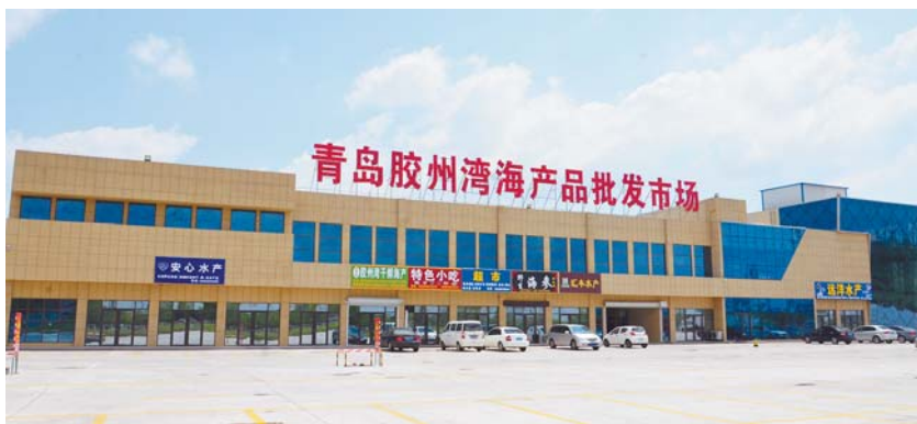
青岛胶州湾海产品批发市场。

中增强纪律性,自觉做到心有所畏、言有所戒、行有所止。狠抓队伍效能建设,加大日常考勤和工作纪律的督察力度,增强队伍的服务意识和责任意识,坚决查处违纪行为。坚持干部队伍“能进能出”和“能者上、庸者下”用人导向,大力推行五个“倡导”,努力打造素质过硬的工作队伍。完善创新考核机制。坚持效率优先,优绩优酬,合理公平原则,进一步激发干部职工的工作积极性、主动性和创造性。