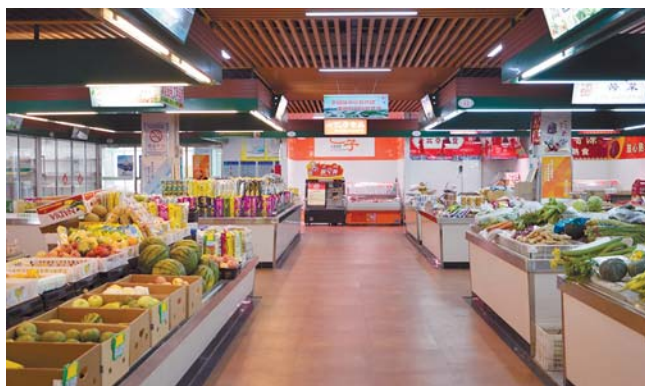
北京路农贸市场内景。

加强内部监督管理。强化审计监管、财务管理、所务公开、工程内部招标等工作,严格执行落实“八项规定”要求,强化廉政建设,使广大干部职工在学思践悟