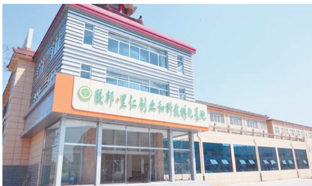
胶邦里仁创业和科技孵化基地。