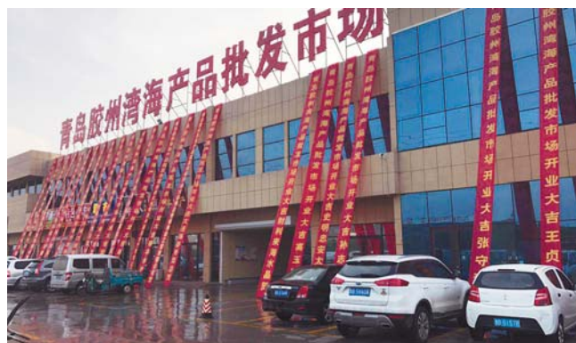
青岛胶州湾海产品批发市场盛大开业。