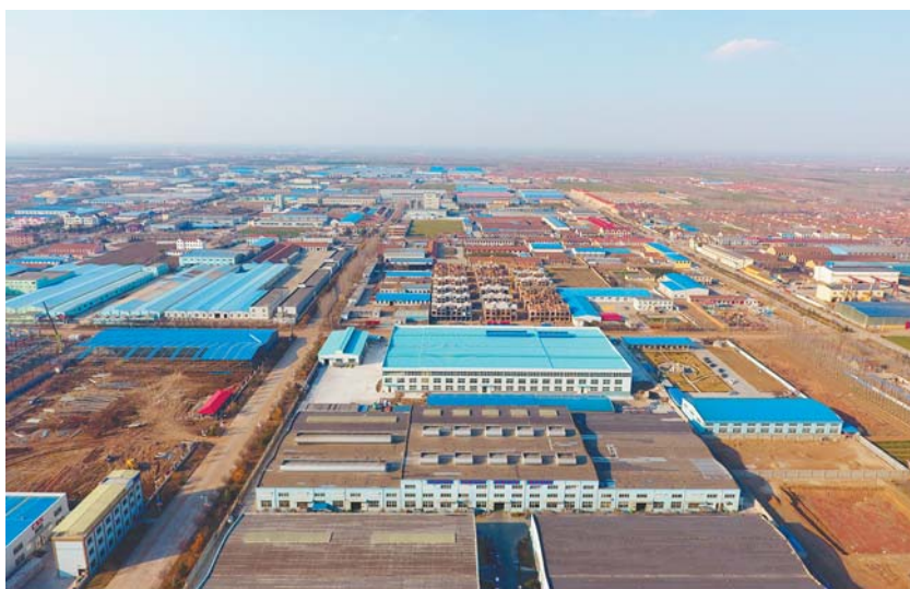
胶莱高端制造业小镇航拍图。

今年以来,始终突出项目建设这一核心,结合全市“三进三促”、“精准招商年”活动,实施“重点项目攻坚行动”,以项目引领高质量发展。一是招商引资取得“新进展”。走访了中国医学装备协会、泉康(香港)投资公司、巴夫洛航空物流公司等8家大公司;接待了中睿集团等12家大企业的投资考察;签约美武软件及电商项目、家乐邦总部基地、亚东仓储物流等8个大项目;还有重点在谈项目16个,包括国际生命科学产业园项目、美好绿色装配式建筑项目等。二是项目建设实现“新突破”。3个青岛市重点项目已开工建设2个,其中:辣椒小镇项目已完成展览展示中心主体工程;彬智智能家居项目2.56万平方米的2号车间已开始主体建设。全镇累计新开工亿元以上纳统项目5个,开工面积12万平方米;竣工投产项目5个,设备投入8000万元。