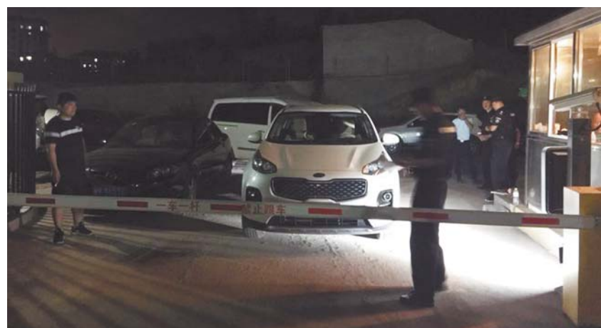
业主的车辆在小区门口等待进门。