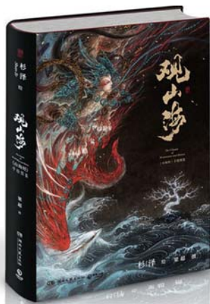
《观山海》 绘者: 杉泽 作者: 梁超 出版社: 湖南文艺出版社

这里之所以不厌其烦地梳理山海经图在中国历史上的传播流布,是因为这些出自明清人之手的图画,当然只能代表明清时人的审美、趣味和想象力。平心而论,这些古图固然有学术价值,也有文献意义,但就其审美而言则殊难令人满意。《观山海》则是一部很有特色的绘本。绘本画风奇崛,色彩艳丽,珍禽异兽整体上具有一种鬼魅之气。看得出,绘者细心揣摩了《山海经》的原文,该有的元素都有,但又最大限度地发挥了自己的想象力。同时,这些绘画均附有《山海经》原文及解说,部分解说还吸收了较新的学术成果,对一些珍禽异兽可能的原型进行了解释和探讨。书中的画作,笔墨、配色等的确是延续了中国美术传统的,但也吸收了日本动漫的一些特点。这也说明,在年轻一代创作者的推动下,只要对艺术创作进行鼓励哪怕仅仅是放宽限制,以中国本土素材为核心并博取各家所长的创作肯定会越来越多。