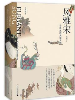
《风雅宋:看得见的大宋文明》 作者: 吴钩 出版社: 广西师范大学出版社

《有趣的会意字》趣在以下几个小地方:一是开本小,小巧精致有趣,便于携带,利于查阅。二是一组同体会意字篇幅不长,碎片化的时间就可以读一段,时不时增加多认汉字的兴趣。异体会意字更是如此。三是笔者将一些会意字的趣味性采用幽默风趣的语言进行解释,增加趣味浓度、深度和广度,说不定你会会会意字会会心一笑。四是将一些与会意字相关联的人和事、文章、图片等适时链接,图文并茂,为读者您茶余饭后增添有趣的话题。