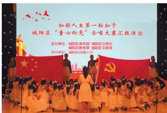
上马街道中心小学节目《你好 新时代》。