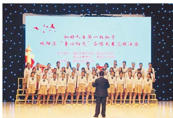
城阳区职业中专节目《青青世界》。