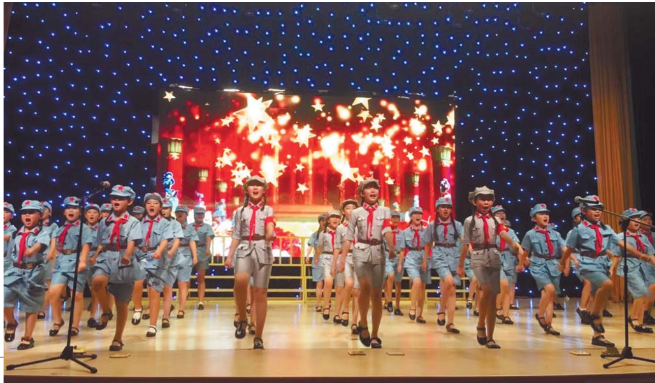
►城阳区实验小学节目《红星歌》。

在七一建党节到来之际,近日,城阳区“童心向党”合唱比赛在城阳区国城小学举行。经前期选拔,共有城阳区实验小学、上马街道中心小学等十支队伍参加本次比赛,除此之外,青岛三十九中、城阳区职业中专、城阳三中现场也带来了精彩演出。参赛队伍以歌颂党、歌颂祖国、歌颂中国梦为主题,带来了一首首耳熟能详、激情澎湃的经典曲目,展示了城阳区广大“阳光少年”昂扬向上的精神风貌。