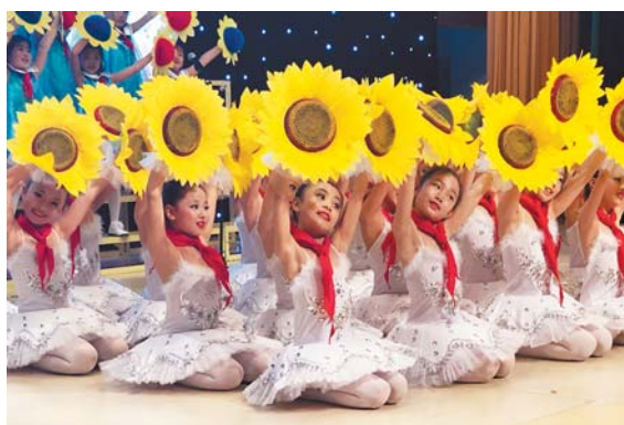
城阳区国城小学节目《快乐阳光》。