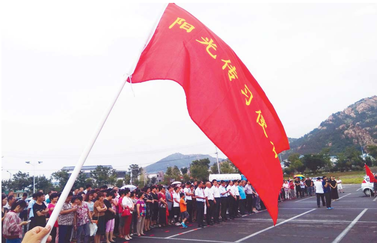
▲阳光传习使者挥动红旗。